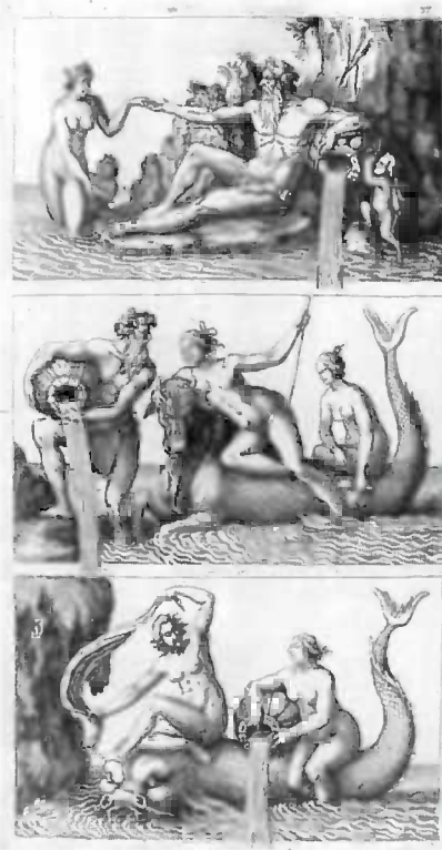
Illustration from: Caus, Salomon de. Hortus Palatinus a Friderico rege Boemiae ... Francofurti : 1620.

The books of the Haupt Collection are significant for their coverage of architectural history. There are also numerous titles that deal with interior design, aesthetics, art history, technology, and garden history. The architectural and art historical portions of the collection include such important works as Leon Battista Alberti's Libri de Re aedificatoria decem (Paris, 1512),