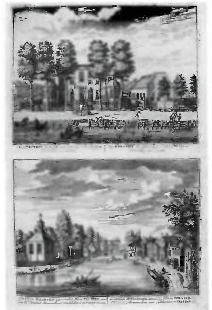
Illustration from: Stopendaal, Daniel. De Vechtstroom. [T'Amsterdam : 1719].

Hortus Herrenhusanus, seu, Plantae rariores quae in horto regio Herrenhusano prope Hannoveram coluntur / auctore Ioanne Christophoro Wendland ... Hannoverae : Prostat venale apud fratres Hahn, 1798-1801. 4 pts. 5 microfiche Order no. 767